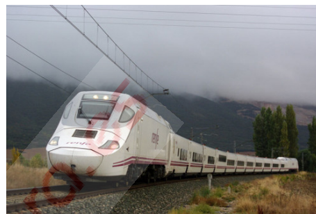
Un Alvia de Renfe que operará la línea hasta Zamora

La conexión ferroviaria de Alta Velocidad (AVE) a Zamora se pondrá en servicio comercial este jueves, 17 de diciembre, según informó Renfe.