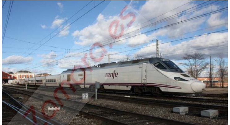
El 17 de diciembre entra en servicio la alta velocidad en Zamora con trenes de la serie 730 y los Alvia gallegos yendo por la convencional.

Sin ningún tren AVE y con sólo una conexión diaria por sentido a través de la nueva infraestructura, a dos días de las elecciones generales la ciudad de Zamora recibirá la alta velocidad. Así, el primer tren con viajeros que circule por el nuevo tramo de la LAV Madrid-Galicia será el Alvia 04884, que sale de Zamora a las 8:50 para llegar a Madrid a las 10:23. El inverso será el Alvia 04995 que parte de Madrid-Chamartín a las 18:50 y llega a Zamora a las 20:23.