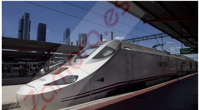
Un tren «Alvia» espera su salida en la estación de Chamartín, en Madrid

Según han informado este miércoles fuentes de Renfe, conectarán Salamanca con Madrid en 1 hora y 36 minutos al circular a través de la línea de alta velocidad Madrid-Segovia-Medina del Campo y continuar viaje por la nueva línea electrificada hasta Salamanca. En principio, se pondrán en servicio seis trenes Alvia a diario (tres de ida y tres de vuelta), lo cual elevará a veinte las conexiones diarias entre Madrid y Salamanca.