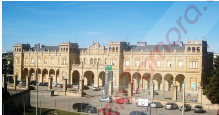
La estación de Zamora estrenará mañana el nuevo tramo de la LAV Madrid-Galicia y recibirá su primer tren eléctrico en servicio.

OPINIÓN.- Damas y caballeros, mañana España tendrá el placer de ser el país con la línea de alta velocidad de menor tráfico del mundo, ¡ un tren por sentido al día! Y no sólo será esto lo que haga que esta infraestructura entre en servicio totalmente infrutilizada. Si bien el tramo Olmedo-Zamora de la LAV (Línea de Alta Velocidad) Madrid-Galicia está diseñado para 300 km/h, la velocidad máxima inicial será tan solo de 200 km/h . Dados los hechos, sólo se me ocurre pensar ¿se está riendo Renfe y Fomento de los zamoranos?