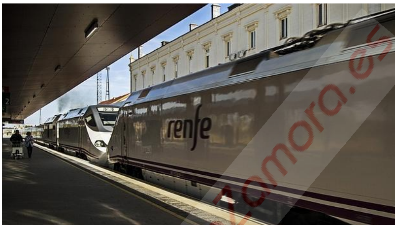
Preparativos el pasado octubre en la estación de Renfe de Zamora para la llegada del AVE

El candidato popular por Zamora al Congreso cree que gracias a la alta velocidad por primera vez la capital zamorana va a ser destino y no lugar de tránsito